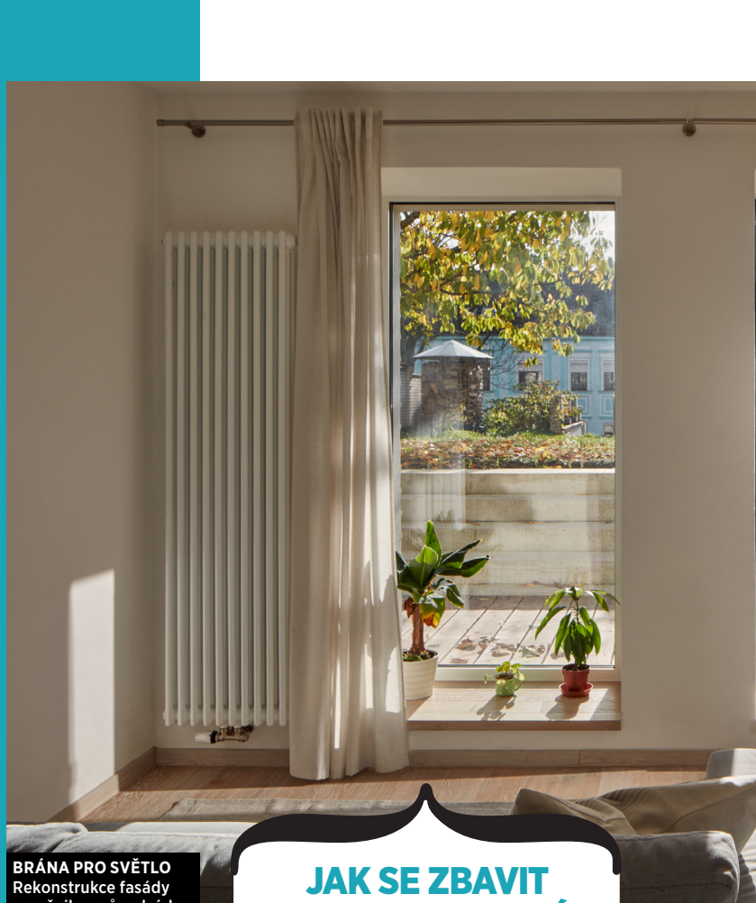
BRÁNA PRO SVĚTLO Rekonstrukce fasády umožnila z původních oken vytvořit velkorysé prosklení s průchodem na terasu

Příkladem je dvoupokojový byt v pražských Střešovicích, který nepřilís velkým, ale důležitým zásahem získal úplně jiný „náboj“ a potažmo i hodnotu. Plánované zateplení fasády bytového domu se stalo příležitostí pro úpravu původně tmavého suterénního bytu, orientovaného do dvora. Na první pohled