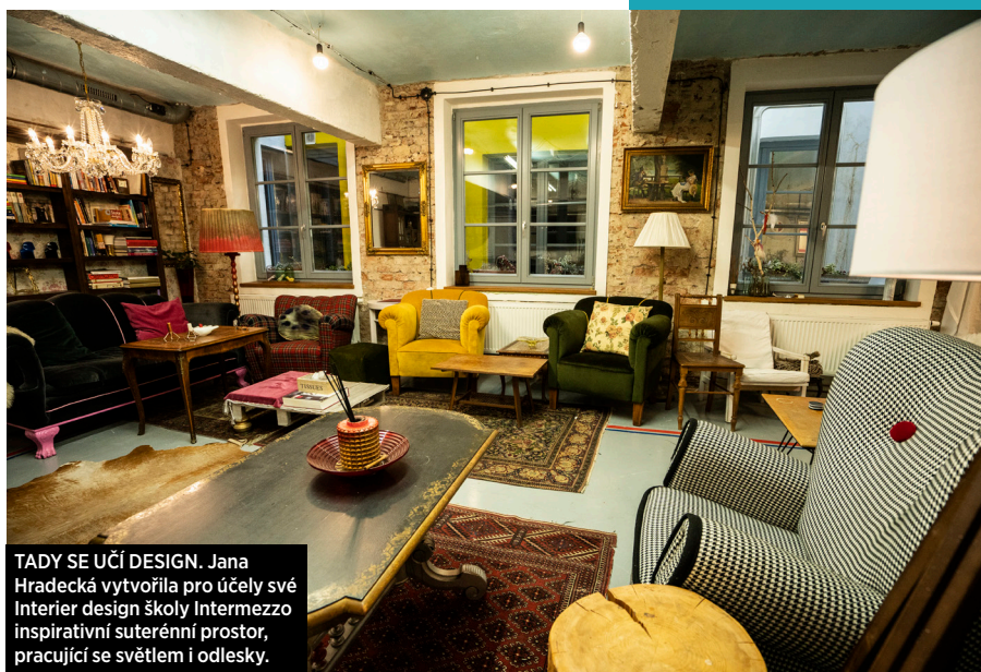
TADY SE UČÍ DESIGN. Jana Hradecká vytvořila pro účely své Interior design školy Intermezzo inspirativní suterénní prostor, pracující se světlem i odlesky.

Při volbě barvy nás bude nejvíce zajímat její světelná odrazivost. „Bílá má nejvyšší odrazivost, nicméně velmi vyčerpává naše oči," podotýká Jana Hradecká. I proto doporučuje sáhnout po tzv. off-white odstínu, který byl použit i ve výše zmíněném libereckém bytě. „Jde o lomenou, lehce tónovanou bílou