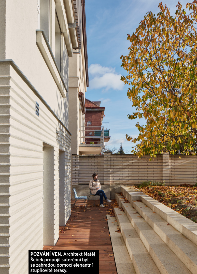
POZVÁNÍ VEN. Architekt Matěj Šebek propojil suterénní byt se zahradou pomocí elegantní stupňovité terasy.

Rouha. To, že šlo o proměnu opravdu k nepoznání, dokládá i komentář majitele, kterému se jeho okolí snažilo koupit „vybydlené a stíněné ruiny“ rozmluvit: „Nejlepší mi přišel moment, kdy uprostřed hotového bytu stál stavbyvedoucí, zasněně se rozhlížel a řekl: Já se vám přiznám, že jsem si na začátku fakt nedokázal představit, že by to tu mohlo vypadat takhle.“