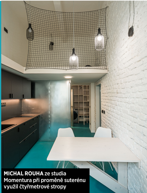
MICHAL ROUHA ze studia Momentura při proměně suterénu využil čtyřmetrové stropy