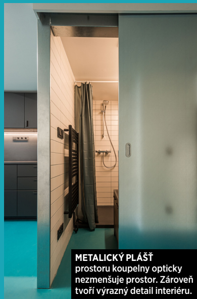
METALICKÝ PLÁŠT prostoru koupelny opticky zmenšuje prostor. Zároveň tvoří výrazný detail interiéru.

NÁKRES BYTU odhaluje plně využitou dispozici se dvěma obyvatelnými patry.