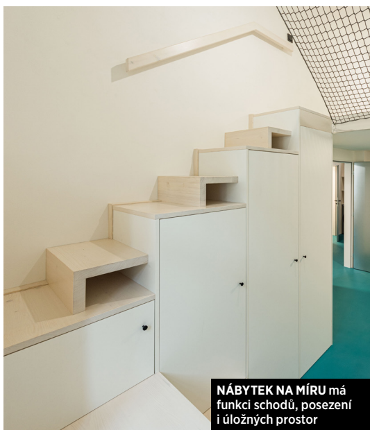
NÁBYTEK NA MÍRU má funkci schodů, posezení i úložný prostor

M áte sklep? A mohli bychom ho vidět? Suterény často bývají temnými a vlhkými prostory či „odkládkárnami“, se kterými se příliš často nechlubíme. Stejně často ale skýtají nezvyklé členění, díky kterému lze vytvořit unikátní prostor s rafinovanými řešeními.