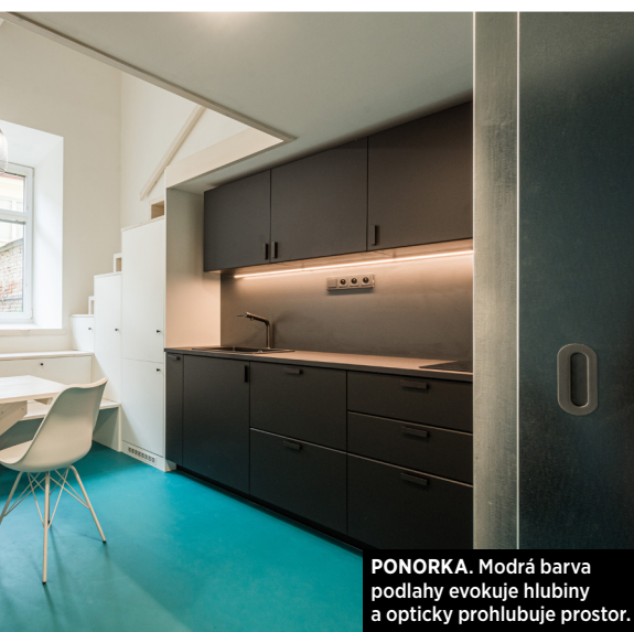
PONORKA. Modrá barva podlahy evokuje hlubiny a opticky prohlubuje prostor.